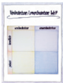
8 Veränderbare/ unveränderbare Welt