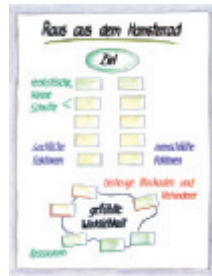
10 Raus aus dem Hamsterrad