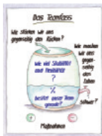
1 Das Teamfass