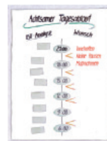
5 Achtsamer Tagesablauf