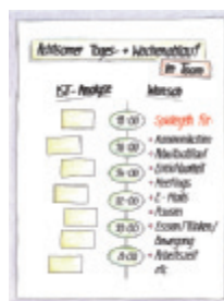
5 Achtbarer Tages- und Wochenablauf