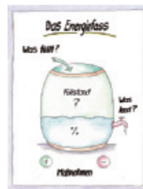
1 Das Energiefass