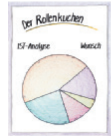
2 Der Rollenkuchen