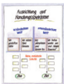
8 Ausrichtung auf Handlungsspielräume