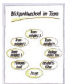
6 Blickpunktwechsel im Team