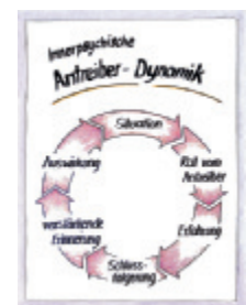
4 Innere Antreiber