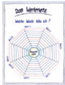
9 Das Werternetz