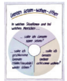
3 Grenzen setzen – wahren – öffnen