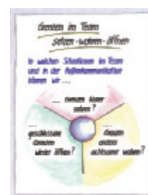
4 Grenzen im Team setzen - wahren - öffnen