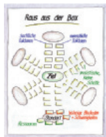
10 Raus aus der Box