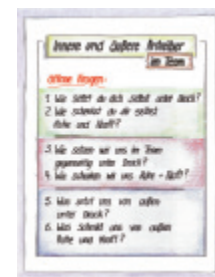
3 Innere und äußere Antreiber im Team